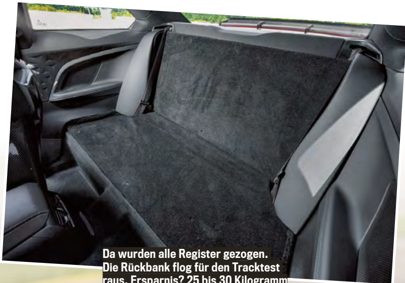
Da wurden alle Register gezogen. Die Rückbank flog für den Tracktest raus. Ersparnis? 25 bis 30 Kilogramm